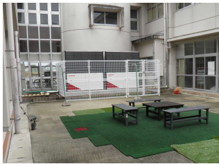
左：2019年から設置されたエアコン