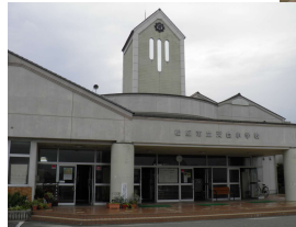
右：校舎と2018年夏、普通教室の代わりに一時利用したコミュニティ広場（現図書室）