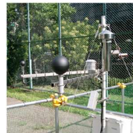
実際の観測の様子